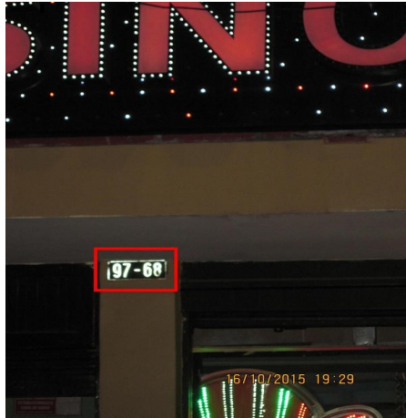
Fotografía N° 2: Nomenclatura del establecimiento BAR BONANZA N C , ubicado en la dirección Calle 17 N° 97 – 68 (Piso 2).